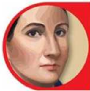
Josefa Ortiz de Domínguez