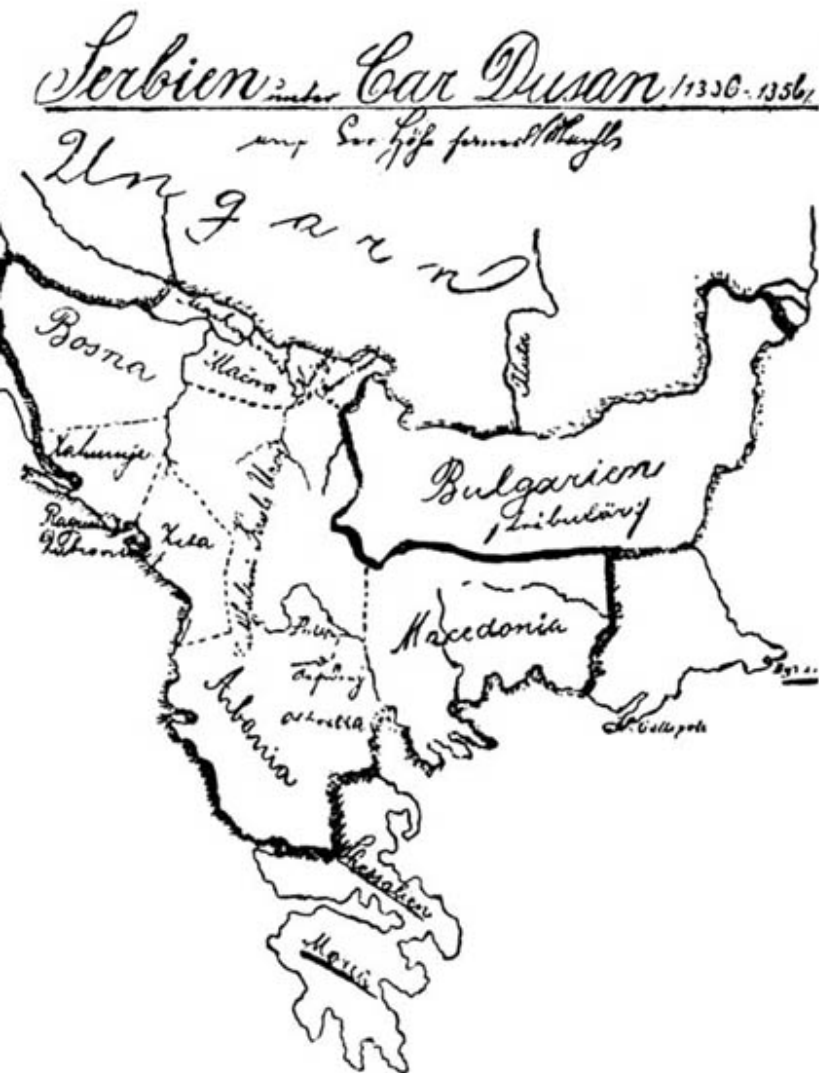
Nemačka karta: Srbija iz Dušanova doba Karta pronađena u pečujskom vojnom arhivu