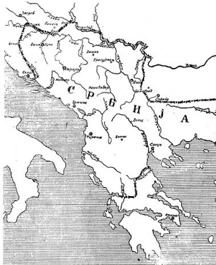
Prema nemačkoj karti pronađenoj u pečujskom vojnom arhivu – rekonstrukcija V. Raičević (Bugarska je na karti označena kao tributarna država)

Tako su teorija o srpsko-hrvatskom bratstvu i bojazan od kritike susednih naroda, čiji su interesi zadirali u srpski istorijsko etnički prostor, osaktili osnovne podatke o starini srpskoga imena i uneli stranu tendenciju koja se docnije kao nezvan gost pretvorila u srpsko naučno pravilo. Može li se čime drugim objasniti, da mnogi strani pisci pre i posle Hrista spominju jake i organizovane Srbe, dok srpski pisci izbegavaju ne samo da to istorijsko bogatstvo ma i sa rezervom citiraju, nego većina od njih izbegava o tome ma šta reći. Može li se oprostiti i takav greh, da su daleko bogatiji prvi, slepilom hrvatskog