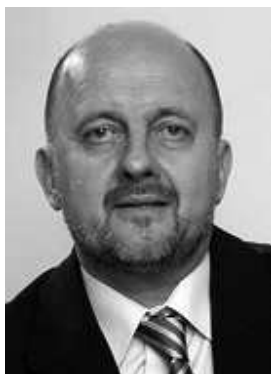
Zmago Jelinčič Plemeniti