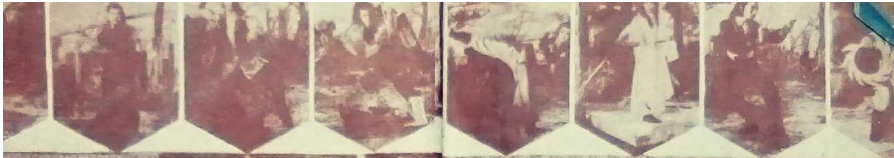
ဇေယျ မောင်အုန်း ညီဘွားစာပေ (၁၃၀၈၈) ၁။ ကျုံးကြီးလမ်း၊ ရန်ကုန်။