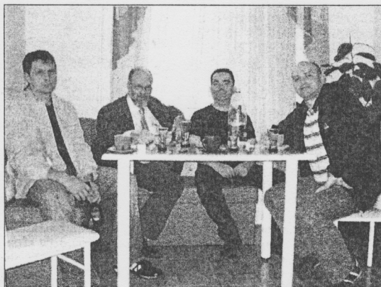
Ηγετικό Στέλεχος των Ουκρανών Εθνικιστών μαζί με τον εκπρόσωπο της εφημερίδας μας και τον υπεύθυνο διεθνών σχέσεων του Γερμανικού κόμματος NPD